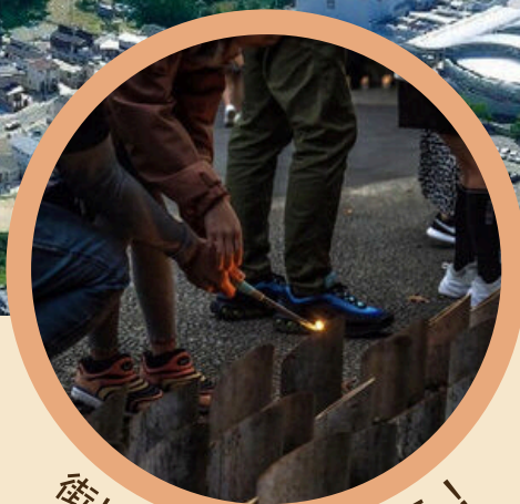
街に竹あかりを灯そう！